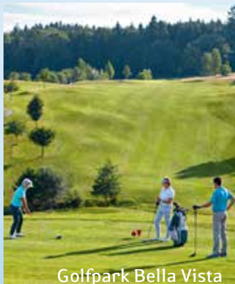
Golfpark Bella Vista