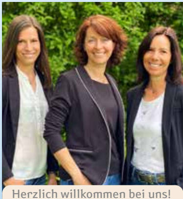
Herzlich willkommen bei uns!