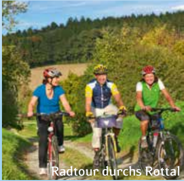
Radtour durchs Rottal