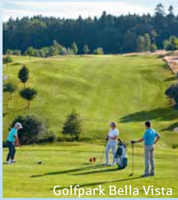
Golfpark Bella Vista