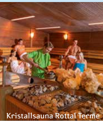
Kristallsauna Rottal Terme

Kostenlos vom Bett ins Bad mit dem Bademantel-Express vom 1. November bis 30. April